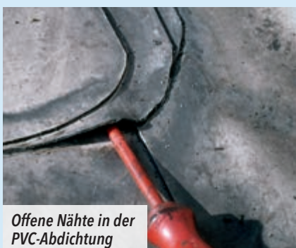
Offene Nähte in der PVC-Abdichtung