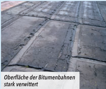
Oberfläche der Bitumenbahnen stark verwittert