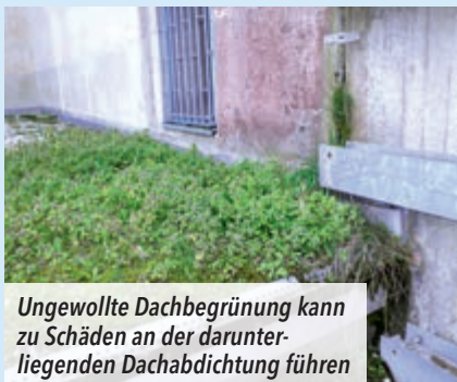
Ungewollte Dachbegrünung kann zu Schäden an der darunterliegenden Dachabdichtung führen