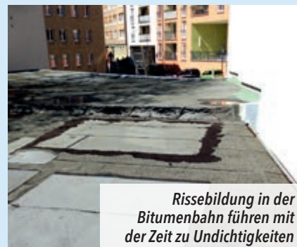
Rissebildung in der Bitumenbahn führen mit der Zeit zu Undichtigkeiten