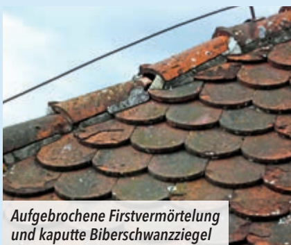
Aufgebrochene Firstvermörtelung und kaputte Biberschwanzziegel