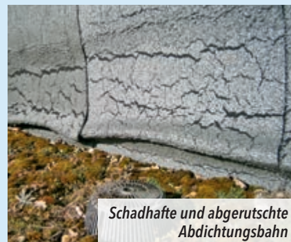
Schadhafte und abgerutschte Abdichtungsbahn