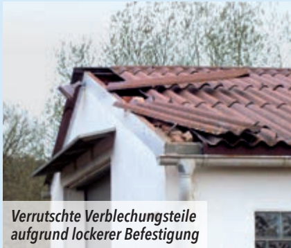
Verrutschte Verblechungsteile aufgrund lockerer Befestigung