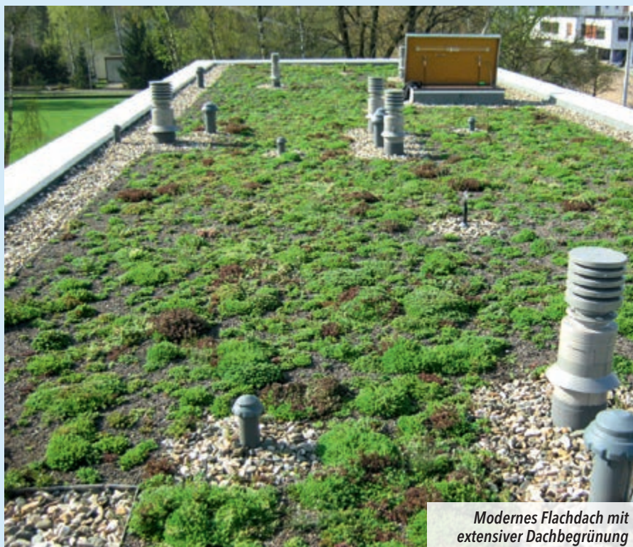
Modernes Flachdach mit extensiver Dachbegrünung

Eine kontinuierliche Inspektion und Wartung (ca. 1–2 Mal pro Jahr) verlängert erheblich die Lebensdauer der Dachabdichtung bzw. der Dachdeckung. Größere Schäden können bereits vor ihrem Eintreten behoben und durch systematische und fachkundige Begutachtung vermieden werden.